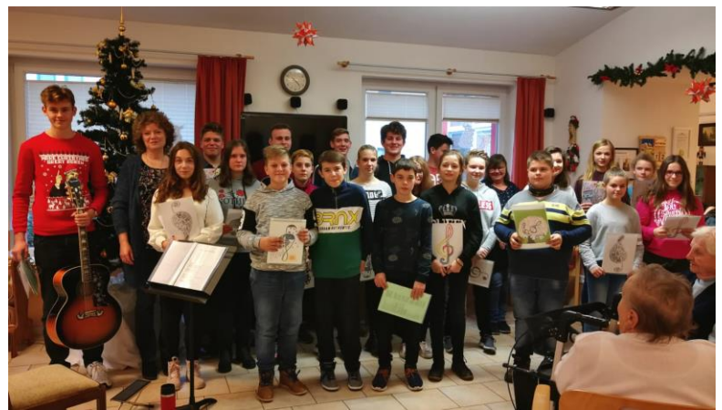
Viel Freude bereitete unser Chor mit seinem Programm im Haus Anna

Wir wünschen allen eine interessante Themenwoche und erholsame Ferien.